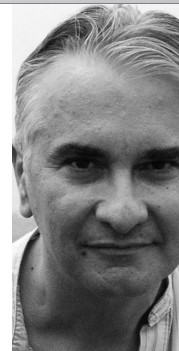
Paul-Antoine Miquel Philosophe